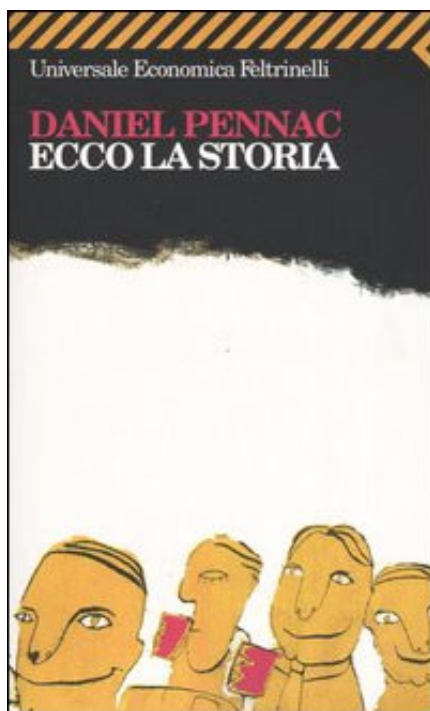
Daniel Pennac, Ecco la storia , Milano, Feltrinelli, 2005

Le parti che compongono la copertina sono tre: