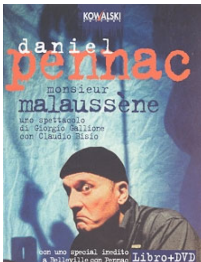
Daniel Pennac, Monsieur Malaussène , Milano Kowalski, 2004. Libro e dvd

comunicazione, può essere schiacciato da se stesso. Come? Attraverso confezioni-paratesto sostitutive del testo . Se è vero che ogni confezione presenta se stessa, oltre che il testo, e quindi produce essa stessa testo, è anche vero che se nasconde il testo interno del prodotto libro ed eccede nel produrre testo proprio, allora sono guai. Il libro ne esce snaturato. Chiariamo.