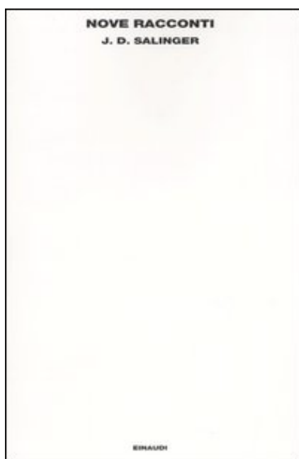
J. D. Salinger, Nove racconti , Torino, Einaudi, ed. 2004

Con cautela, prendo in mano Nove racconti , di J.D. Salinger. Casa editrice Einaudi.