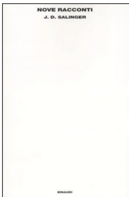
J. D. Salinger, Nove racconti , Torino, Einaudi, ed. 2004

La copertina del mio libro è bianca. E' scomparsa la cornice nerissima che racchiudeva altro bianco nei precedenti libri dello scrittore. Il nome della casa editrice, sempre centrale e comunque nerissimo, è stato spinto verso il basso, a pochi centimetri dal bordo pagina. Dov'è lo struzzo, simbolo della casa editrice?